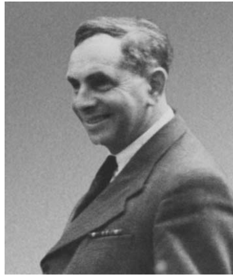
Александр Соломонович Шмарьян