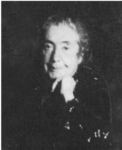
Лина Соломоновна Штерн